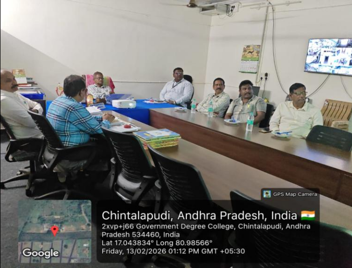
Chintalapudi, Andhra Pradesh, India 2xvp+j66 Government Degree College, Chintalapudi, Andhra Pradesh 534460, India Lat 17.043834° Long 80.98566° Friday, 13/02/2026 01:12 PM GMT +05:30