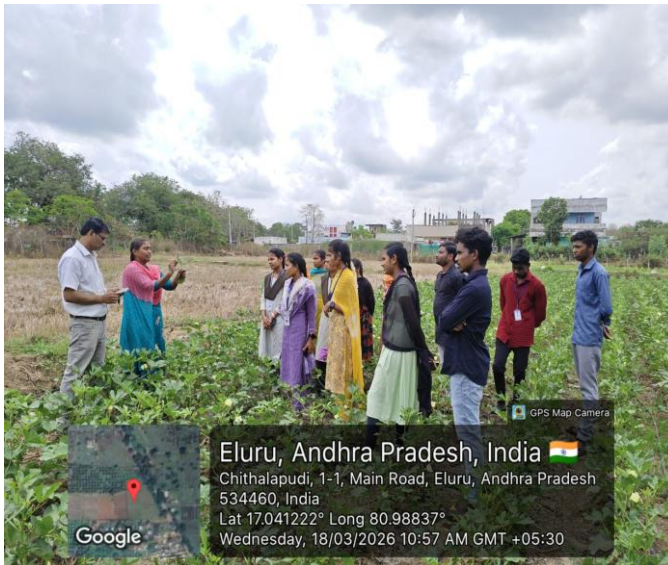
Eluru, Andhra Pradesh, India Chitalapudi, 1-1, Main Road, Eluru, Andhra Pradesh 534460, India Lat 17.041222° Long 80.98837° Wednesday, 18/03/2026 10:57 AM GMT +05:30