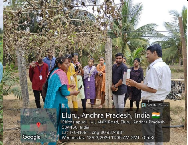
Eluru, Andhra Pradesh, India Chitalapudi, 1-1, Main Road, Eluru, Andhra Pradesh 534460, India Lat 17.04109° Long 80.987493° Wednesday, 18/03/2026 11:05 AM GMT +05:30