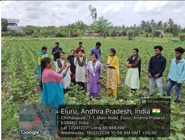
Eluru, Andhra Pradesh, India Chitalapudi, 1-1, Main Road, Eluru, Andhra Pradesh 534460, India Lat 17.041227° Long 80.988398° Wednesday, 18/03/2026 10:56 AM GMT +05:30